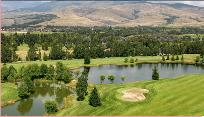
Barrio del Golf, 17539 Puigcerdà, Girona