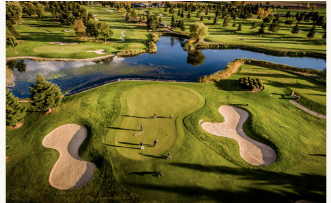
Carretera Soriguerola, 17538, Girona

Le Golf Club de Fontanals, situé dans la région de la Catalogne en Espagne, est une destination prisée pour les amateurs de golf en quête d'une expérience exceptionnelle. Niché au cœur des paysages magnifiques des Pyrénées catalanes, ce club offre un cadre pittoresque et serein pour les golfeurs de tous niveaux.